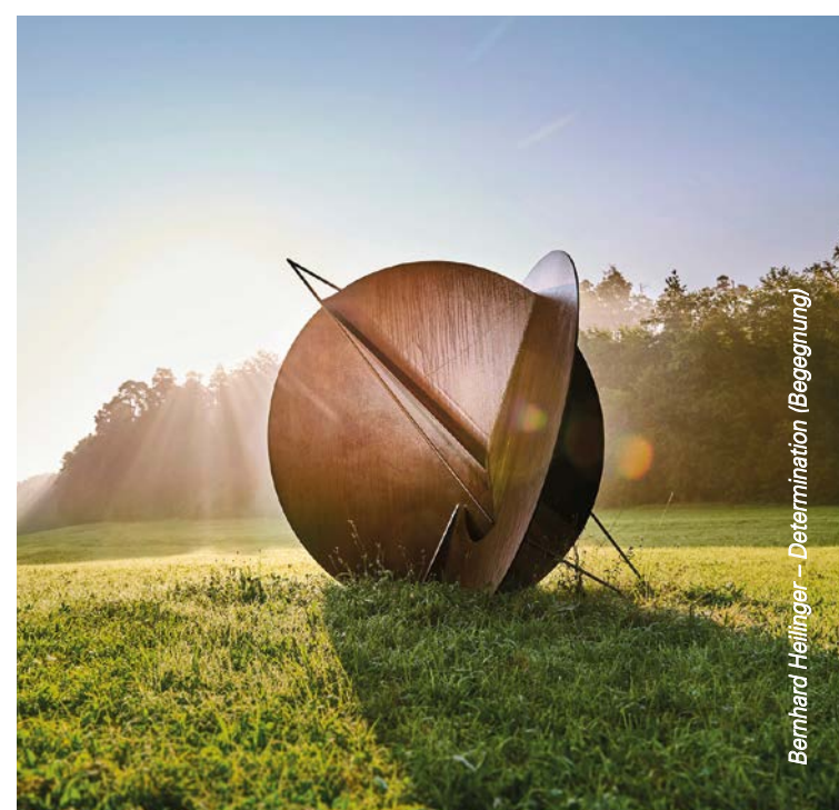
Bernhard Heilingner – Determination (Begegnung)

an alle Künstler, Grundstücksbesitzer, Kommunen, Sponsoren und die vielen Unterstützer, die das Natur-Kunst-Erlebnis der SCULPTOURA möglich machen!