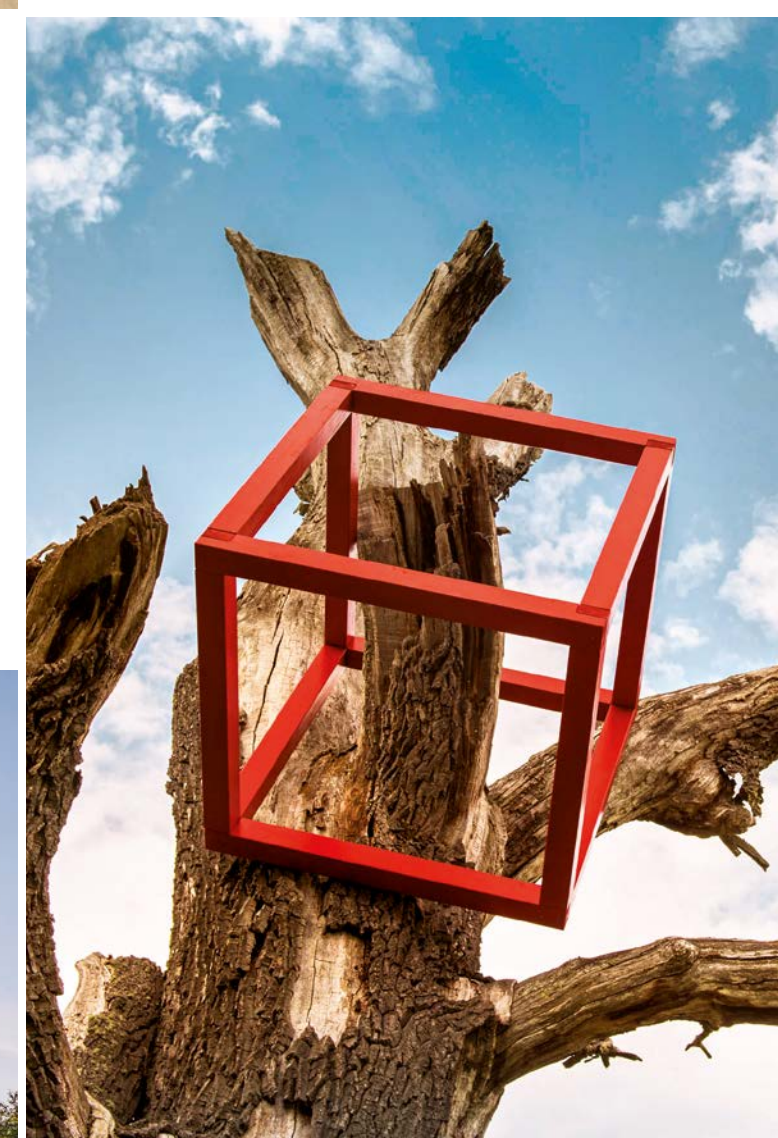
HD Schrader – cubes and trees