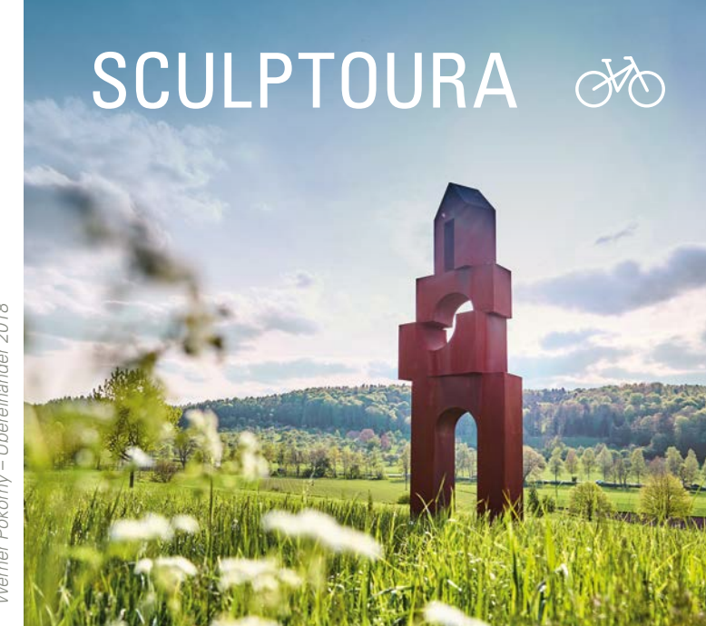
Werner Pokorny – Überländer 2018