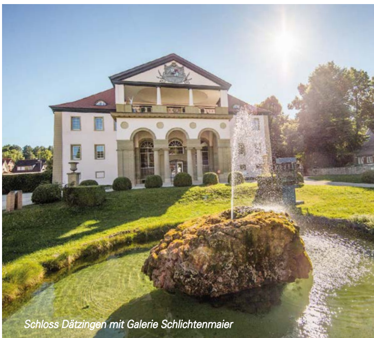
Schloss Dätzingen mit Galerie Schlichtenmaier