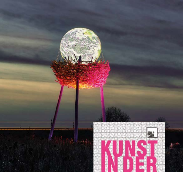
Mathias Schweikle – Vogelnest 5x5